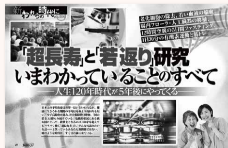
▲雑誌などで取り上げられ注目が集まる「若返り」成分NMN