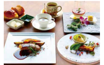
料理長が厳選した大分県産食材満載の料理は絶品