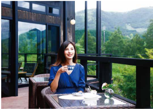
「天空のカフェ ゆふいん」からは、由布岳や由布院の街並みを一望

“豊後富士”と称される由布岳の雄大な姿に心洗われ、神秘さえ感じる…。そんな日常では味わえない感動に浸れるのが、会員制リゾートホテル「由布院別邸」なのです。