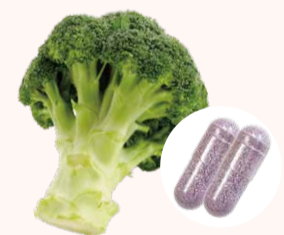
1日分(2粒)にブロッコリー3,200房分のNMNを凝縮配合

「NMN」は最先端の次世代型エイジングケア成分として、世界中の専門機関で研究が進められており、テレビや雑誌などメディアも大注目。すでに、ご愛用者様から「朝までぐっすり」「肌の調子が良い」「老眼鏡が不要に」といった大きな反響のある「ロングライフNMN」。浸透率・吸収率を高めたNMNを、1粒で100mg補給可能で、品質と信頼性の高さでも好評です。ぜひ、お試しください。