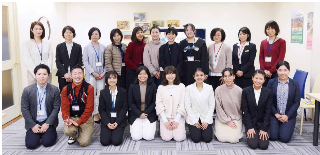
「グローバル人財活躍推進チーム」の座談会での集合写真

ロングライフグループでは、常に「グッドフイーリング」を意識し、お客様に「ロングライフはこんなことまでしてくれるのか!」と感動していただけのサービスを目指してきました。国内にとどまらず、世界をも視野に入れて事業展開してきた