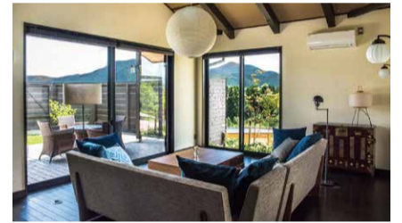
リビングから絶景を独り占め