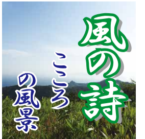
風の詩 こころ の風景

春3月。春は花、花は桜。この時季待たれる桜のたより。桜前線の進み具合が気になる季節だ。日本の春は桜の開花が運ぶのか。南から北へと移り進むといわれてきた桜前線も、この何年かは決まったように運んでいないようだ。そう思っているのは人間の勝手な思い込みだろうか。 自然の営みは人間の思惑通りにはならないもの。と知ろう。本来はそういうことだと知っていても、それでも、そうあつてほしいという望みが眩かせる。 花開く時を待つ心の高揚は春にふさわしい期待の季節だけれど、ここに来るまでの秋から、木枯の吹く冬の時間を、意識したか。 人びとが寒さを温かい環境の中に身を避ける時も、寒風にさらされた樹木の営みに思いを寄せただろうか。 北風の唸り襲い来る中で根を張り、梢まで送り続ける命の流れを聞いたか。自然の中に生きる人間。その恩恵を心に留めて桜の季節を生かせてもらおう。