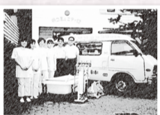
1990年2月 厚生省(現厚生労働省)所管社