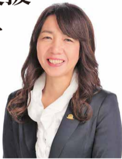
公益社団法人 大阪介護福祉士会