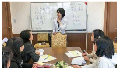
入社時の研修の様子