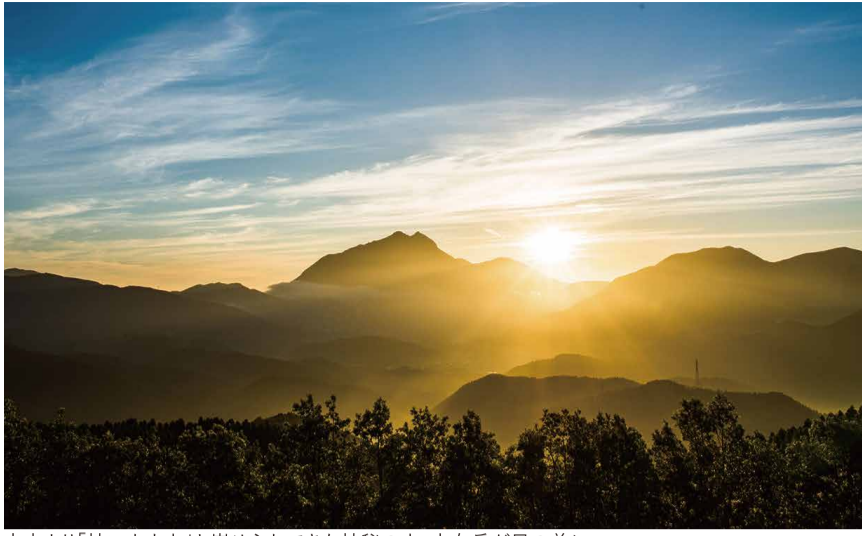
古来より「神います山」と崇められてきた神秘の山・由布岳が目の前に…