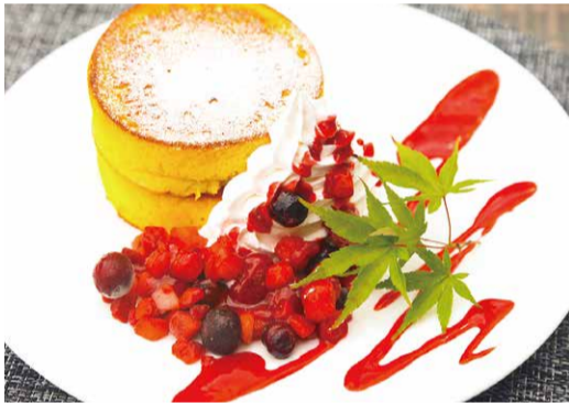
「天空パンケーキ」の生地には高塚赤鶏の卵を使用。優しい食感が魅力。

大正ロマンを感じる 寛ぎの空間 由布院が温泉保養地として発展したのは大正に入ってから。そんな背景