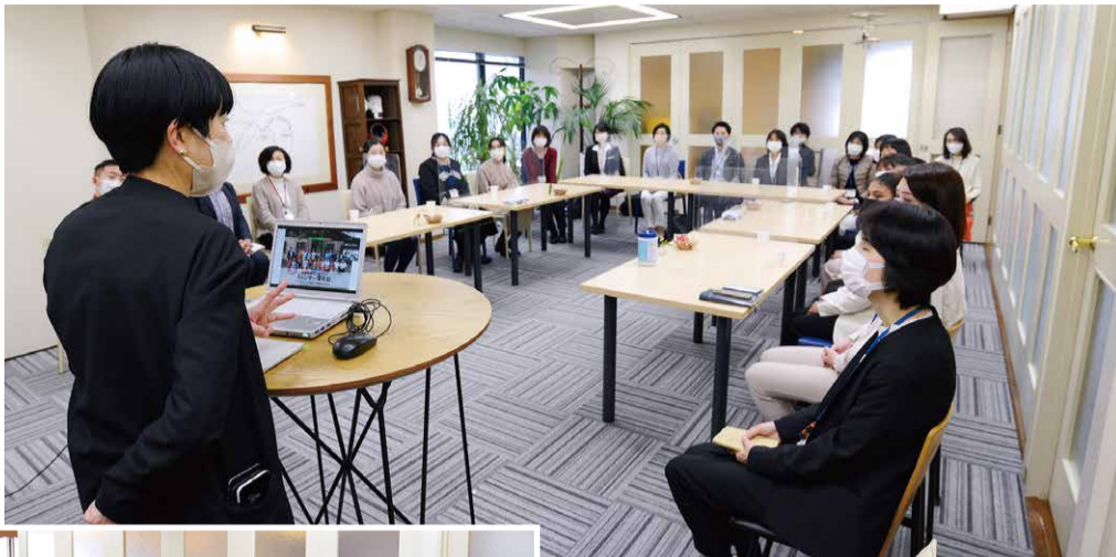
「グローバル人財活躍推進チーム」の座談会の様子