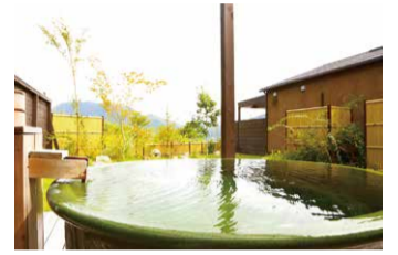
柔らかな湯触りの天然温泉を露天風呂で満喫

「自家製焙煎コーヒー」など、魅力的なカフェメニューが充実しています。レストランでいただくディナーは、大分の豊かな自然に育まれた豊後牛や鹿、鴨といったジビエ、別府湾や豊後水道で獲れた新鮮な魚介類を使ったカジュアルフレンチのコース、朝食には地元名産の椎茸やカボスを。地